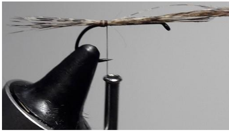
Mettre quelques fibres de pardo en queue.