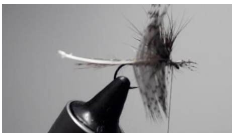
Fixer une plume de perdrix par la pointe.