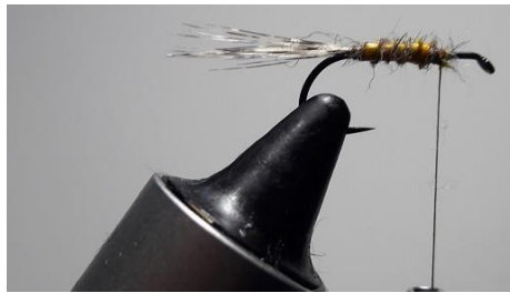
Tourner le Quill par-dessus. Vernir pour consolider le tout.