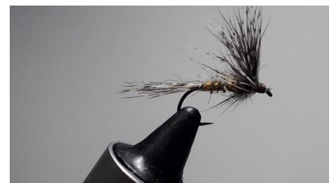
Former la tête, nœud final et une goutte de vernis.