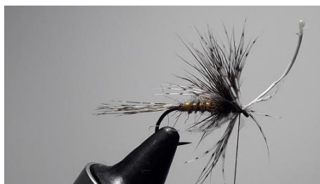
Tourner 3 tours de perdrix et bloquer.