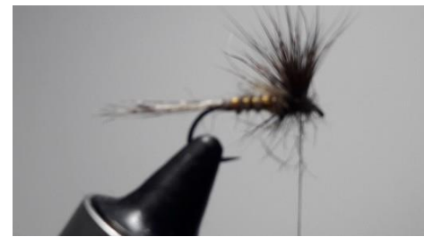
Tourner devant et derrière l'aile.