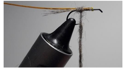
Préparer un dubbing de lièvre pour le sous corps.