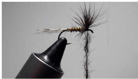
Préparer un autre dubbing d'oreille de lièvre.