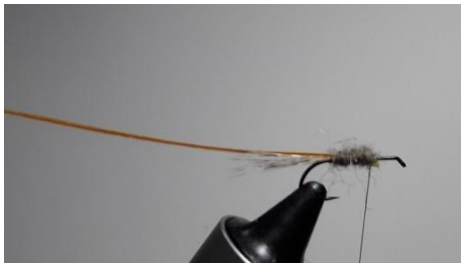
Former ainsi le sous corps.