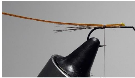
Fixer le substitut de condor.