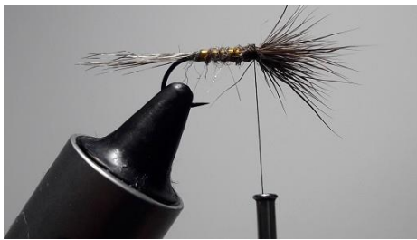
La fixer pointe vers l'avant. Couper l'excédent et la redresser.