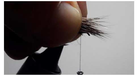
Préparer une touffe de chevreuil.