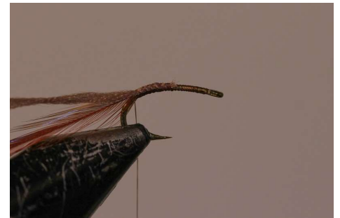
Fixer la plume de coq roux et le polyfloss camel.