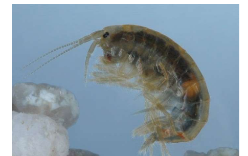
Le gammare réel.