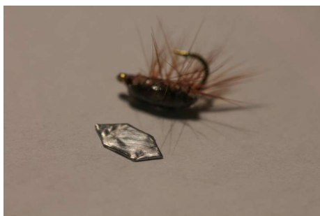
Former un morceau de plomb plat biseauté et collez le dessus.