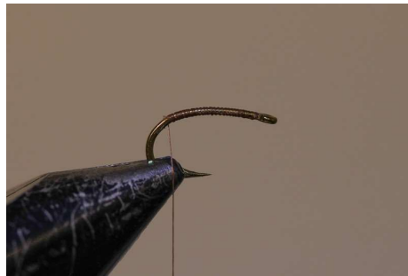
Amener le fil de montage à la courbure de l'hameçon.