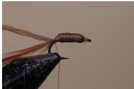
Recouvrir tout le corps avec le polyfloss et laisser en attente.