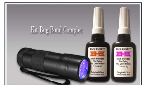
Ensuite passer 2 couches de colle UV pour faire la carapace.