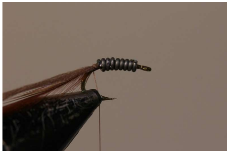
Faire 10 tours de plomb en 0.6 mm.