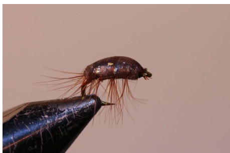
Ou /et rajouter des couches de vernis clair rapide JMC.