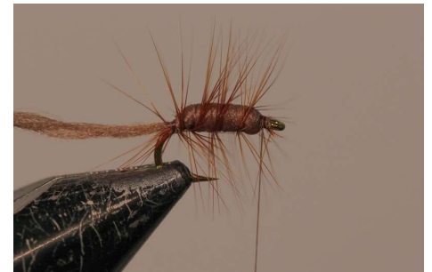
Tourner le hackle roux bien espacé.