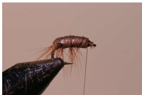
Repasser ensuite avec le polyfloss sans emprisonner les fibres/pattes.