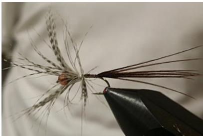
Enrouler la plume de sarcelle en spire jointives, fixer puis couper L'excédent