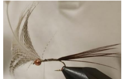
Fixer la plume de sarcelle derrière la bille par la pointe