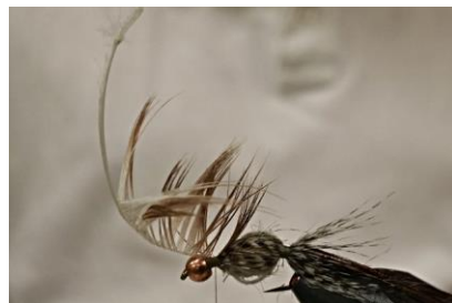
Fixer la plume de flanc de canne par la pointe