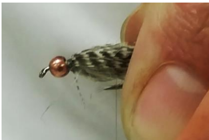
Rabattre la plume de sarcelle vers l'arrière uniformément autour du corps en dubbing