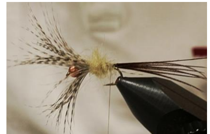
Monter le sous corps en enroulant le dubbing de l'avant vers l'arrière