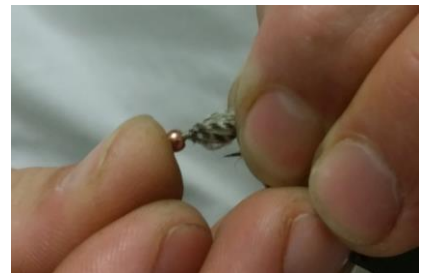
Repousser les fibres vers l'avant afin de "gonfler" le corps