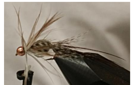
Enrouler en spire jointive, fixer et couper l'excédent. Wipfinish