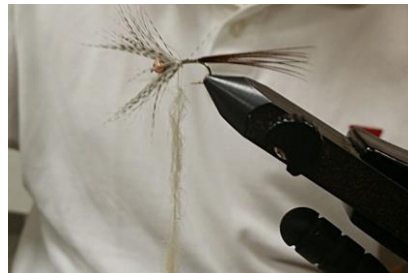
Préparer un dubbing de phoque naturel