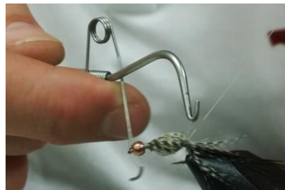
Fixer les fibres de sarcelle à l'arrière du dubbing, fibres tendues grâce à un wipfinish, couper la soie de montage