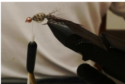
Fixer la soie de montage derrière la bille