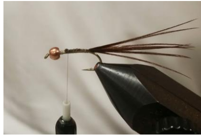
Fixer quelques fibres de faisan commun en queue