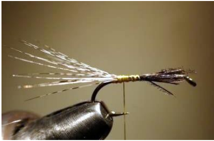
Poser les cerques, en éventail, ou pas, selon affinité!