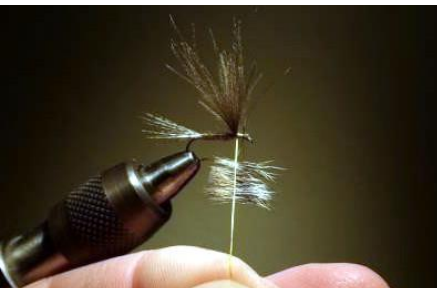
Twister la boucle