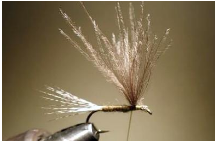
Passer derrière, redresser l'aile puis faire une boucle à dubbing.