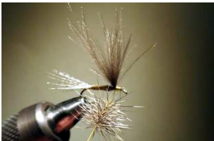
Enrouler , un tour derrière, deux devant...