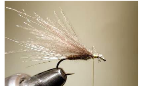
Poser une touffe de CDC de couleur sombre pour imiter les Rhodanis.