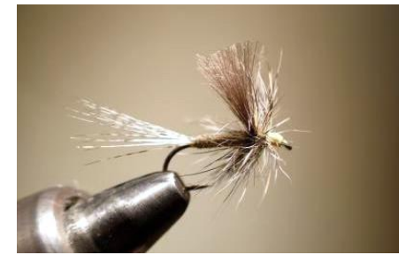
Nettoyer les poils de travers et faire un whip finish