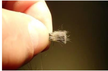
Prendre une petite pincée de poils d'écureuil.