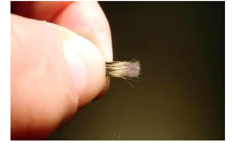
Eliminer la bourre et les longs poils noirs de devant.