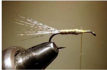
Faire un corps en fil de montage ou comme ici en dubbing synthétique.