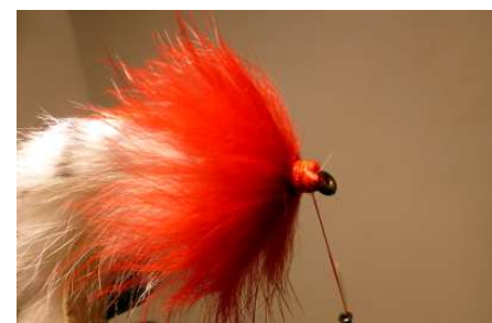
Enrouler en spires jointives jusqu'à la tête. Fixer le brin de fil nylon en tête pour faire l'anti herbe.