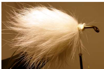
Bloquer solidement et coller