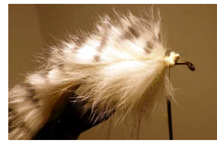
Poser en tête une grande lanière de 8 mm en lapin (ici blanc zébré). Bloquer solidement (nœud + colle) couper le fil blanc