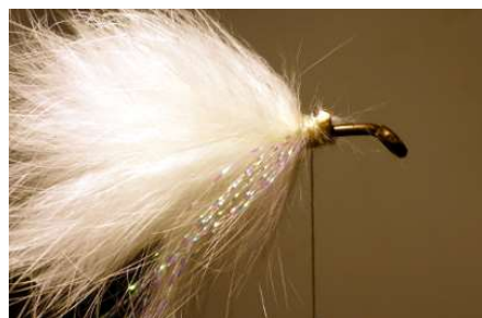
Poser quelques brins de fibres blanc perle de chaque coté