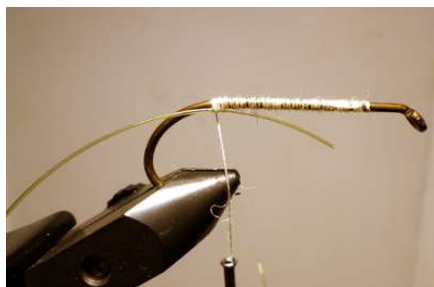
Sur un hameçon de 0/1 a 0/6 posé un fil solide blanc et bloquer un morceau de fil nylon de 70 à 80/100 sur l'arrière