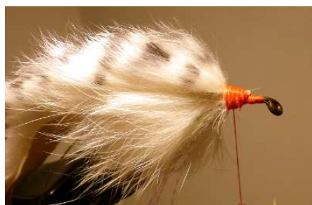
Poser un fil rouge solide