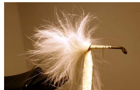
Enrouler en spire jointives