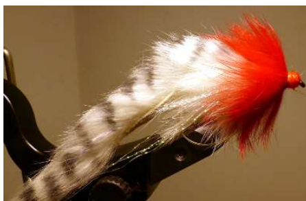
Finir la tête Bloquer solidement et sceller avec de la colle.