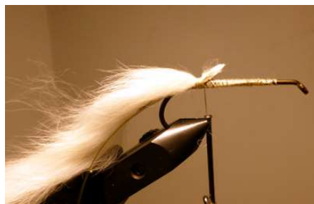
Poser un morceau de lanière de 5 en lapin blanc