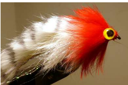
Poser deux yeux a la colle gel cyano a la base de la ligature et du lapin rouge.