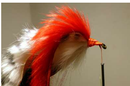
Poser un morceau de lanière de 4 a 5 mm de lapin rouge