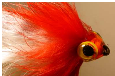
Finir de renforcer la tête a la résine UV Mouche terminée