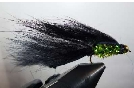
Consolider le montage derrière la bille et faire le nœud final. Un goutte de colle. Mouche terminé