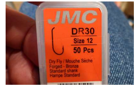
La référence de l'hameçon utilisé pour le montage