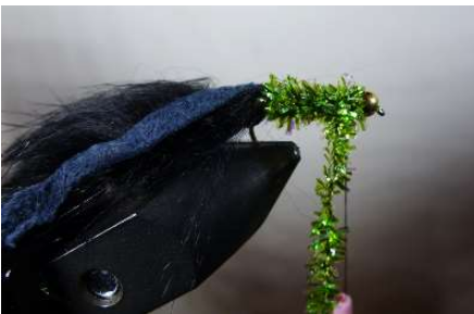
Fixer le Fritz et enrouler serré jusqu'à la bille