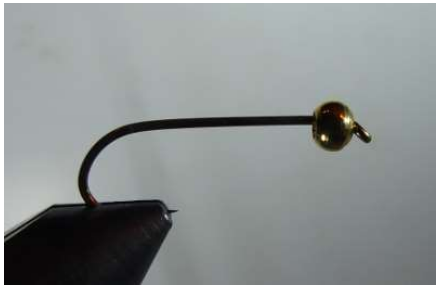
Sur un hameçon de 12 placer une bille de laiton de 2.8mm