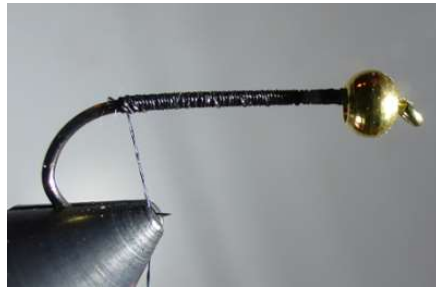
Fixer le fil de montage