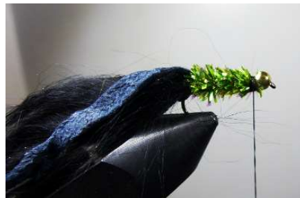
Fixer solidement le toupet par des tours en huit