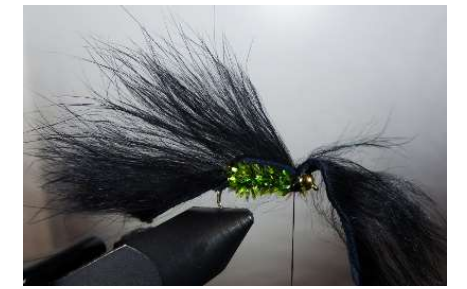
Rabattre la lanière de lapin et fixer derrière la bille