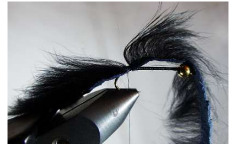
Fixer une lanière de lapin (queue > 2 x la longueur de l'hameçon) et rabattre vers l'arrière en attente