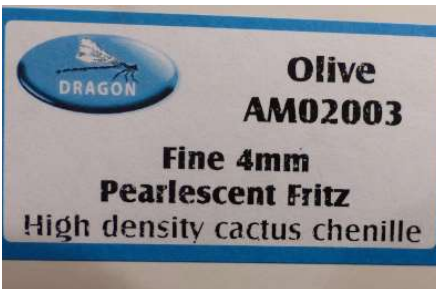
La référence du fritz utilisé