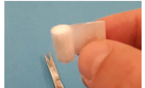
Avec une paire de ciseaux, supprimer le papier du filtre