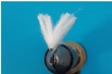
Vue de face avant son immersion ...