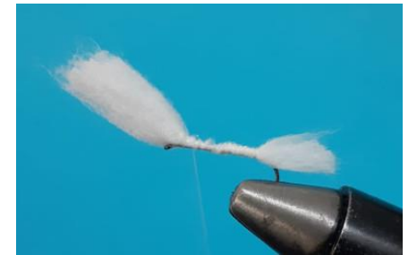
Fixer les ailes en considérant environ deux fois plus de fibres que pour les cerques