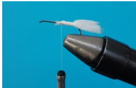
Fixer les fibres pour former les cerques