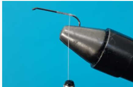
Poser le fil jusqu'à la courbure de l'hameçon