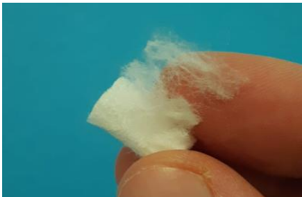
Extraire le filtre en prenant soin d'aérer les fibres