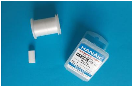
Très peu de matériel pour cette mouche