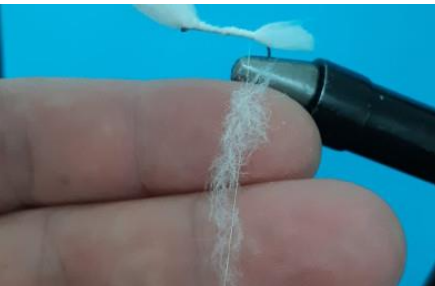
Réaliser une mèche à dubbing en mettant de la fibre de façon très aérée.