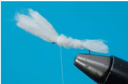
Réaliser le corps en remontant vers l'œillet de l'hameçon