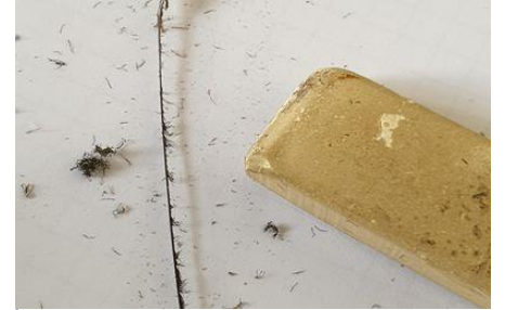
Ébarber le quill de paon à l'aide d'une gomme.