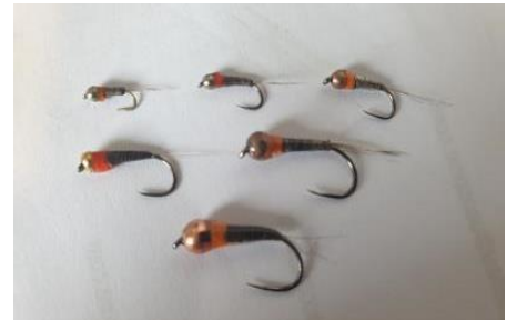
Nymphes de tailles 10 à 20. Les tailles usuelles sont 12 à 16.