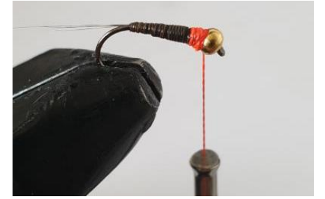
Faire un tag avec le fil orange derrière la bille puis faire le noeud final.