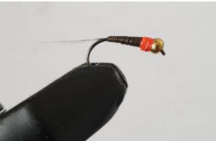
Voici la nymphe avant application du verni.