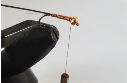
Fixer le quill de paon puis ramener le fil de montage derrière la bille.