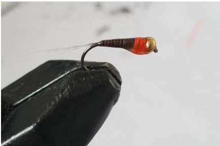
Nymphe vernie, vérifier que l'œillet est bien dégagé.