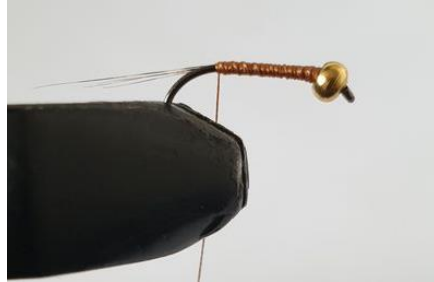
Former le sous corps avec la soie de montage.