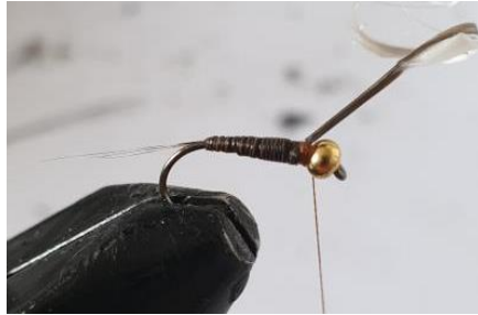
Enrouler le quill en spires jointives jusqu'à la bille, le fixer par un nœud.