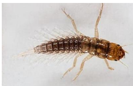
La nymphe de Sialis

Terminer par un blocage du fil de montage derrière l'oeillet, sous la tête en foam. Ajuster la longueur de la tête par un coup de ciseaux.