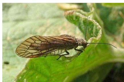
Le Sialis adulte