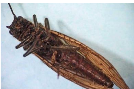
Le Sialis vu de dessous