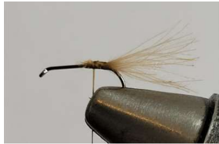
Fixer les fibres de CDC pour former les cerques