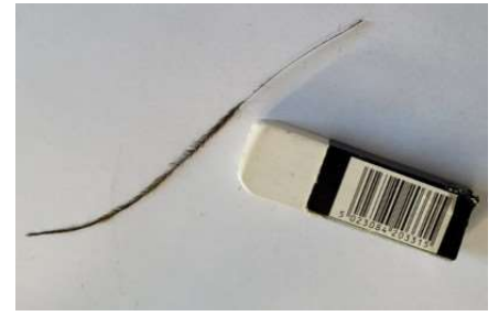
Ebarber le quill de paon à l'aide d'une gomme