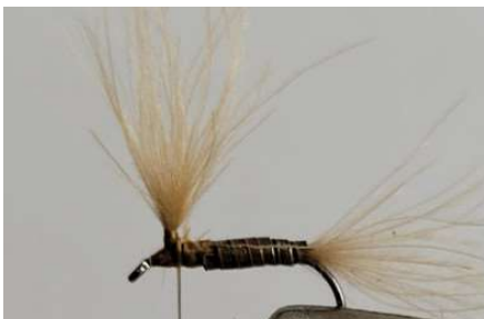
Remonter l'ensemble des fibres puis créer une potence en effectuant quelques tours de fil de montage.