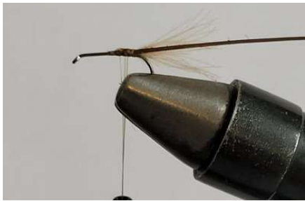
Fixer le quill de paon