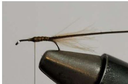
Former un sous corps avec la soie de montage