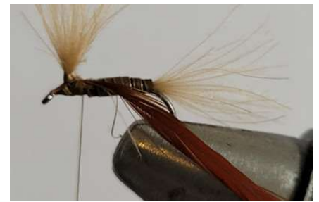
Fixer le hackle de coq.