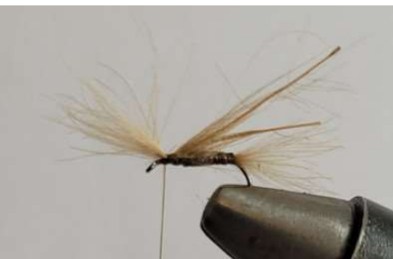
Disposer des fibres de CDC en direction de l'œillet