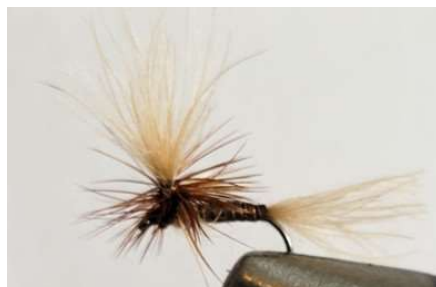
Effectuer les enroulements du hackle autour de l'aile en CDC puis effectuer le nœud final.