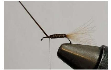
Effectuer les enroulements avec le quill sur les \frac{3}{4} de la hampe de l'hameçon.