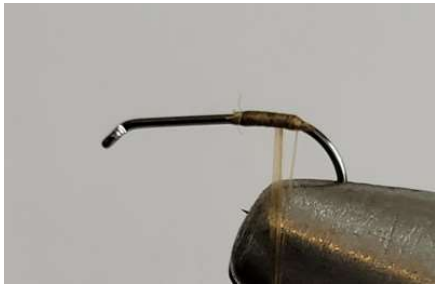
Poser le fil jusqu'à la courbure de l'hameçon.