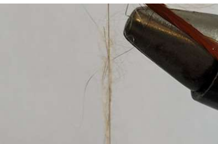
Réaliser une mèche à dubbing et l'enrouler de part et d'autre de l'aile en CDC