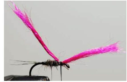
Poser votre antron et fixer le avec fil de montage