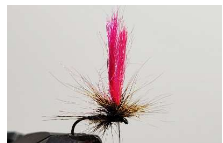
Il faut ensuite tourner autour de votre mèche d'antron du haut vers le bas.