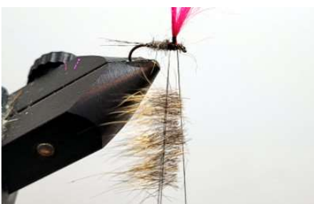
Faire une dubbing loop et positionner vos poils d'oreille de chevreuil