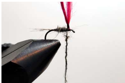
Réaliser une mèche de dubbing écureuil noir