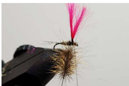
Twister votre dubbing loop