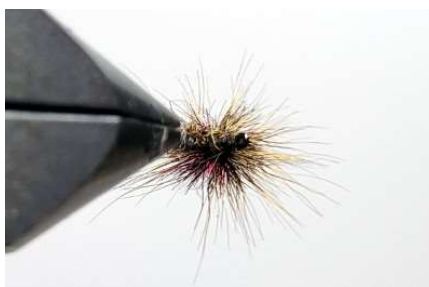
Vue du dessous