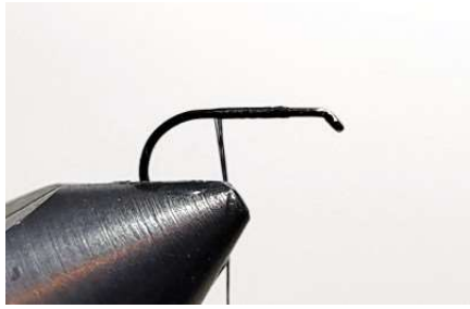
Poser votre hameçon (ici de taille 16)