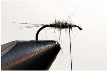
Enrouler sur la hampe de l'hameçon