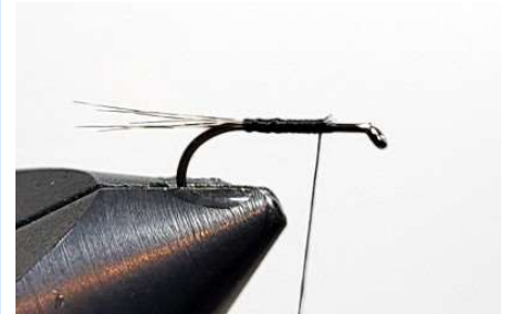
Couper l'excédent de pardo