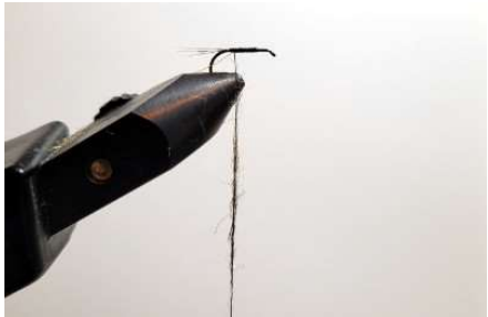
Revenir à la courbure de l'hameçon et faire une mèche de dubbing écureuil gris.