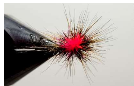
Vue du dessus