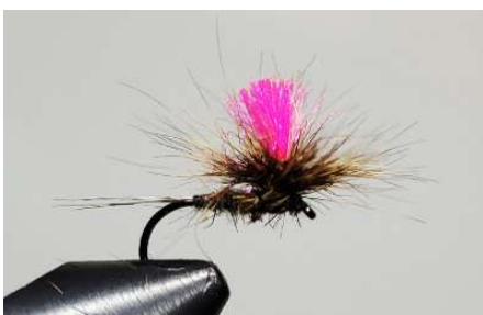
Supprimer les poils superflus qui dépassent. Couper l'antron. Nœud final. Mouche terminée