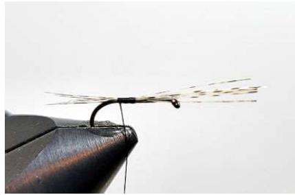
Fixer votre pardo avec votre soie de montage