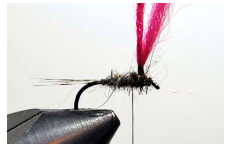
Réaliser votre thorax autour du parachute