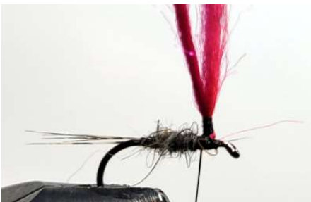
Remonter votre fil sur l'antron puis redescendre